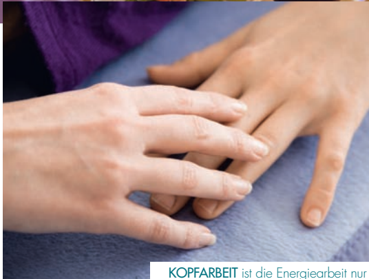
KOPFARBEIT ist die Energiearbeit nur zu einem kleinen Teil. Worauf es dabei viel mehr ankommt, ist Intuition. Zu spüren, welche Berührungen dem anderen guttun.